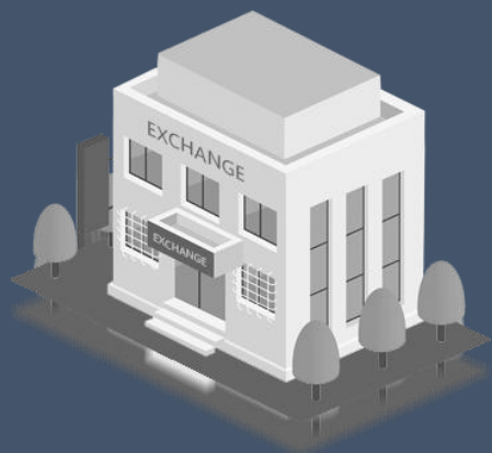
全球十三大交易所